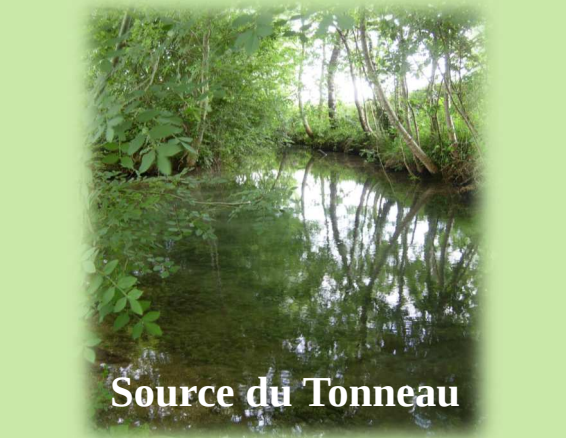
Source du Tonneau