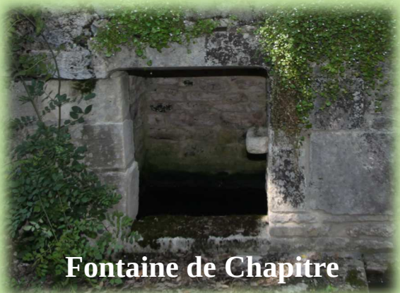
Fontaine de Chapitre