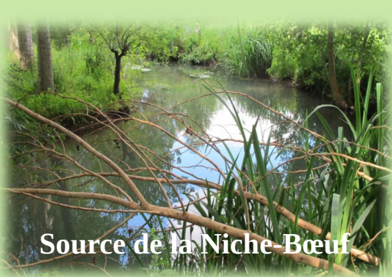
Source de la Niche-Bœuf