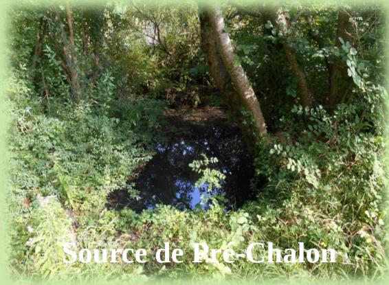
Source de Pré-Chalon