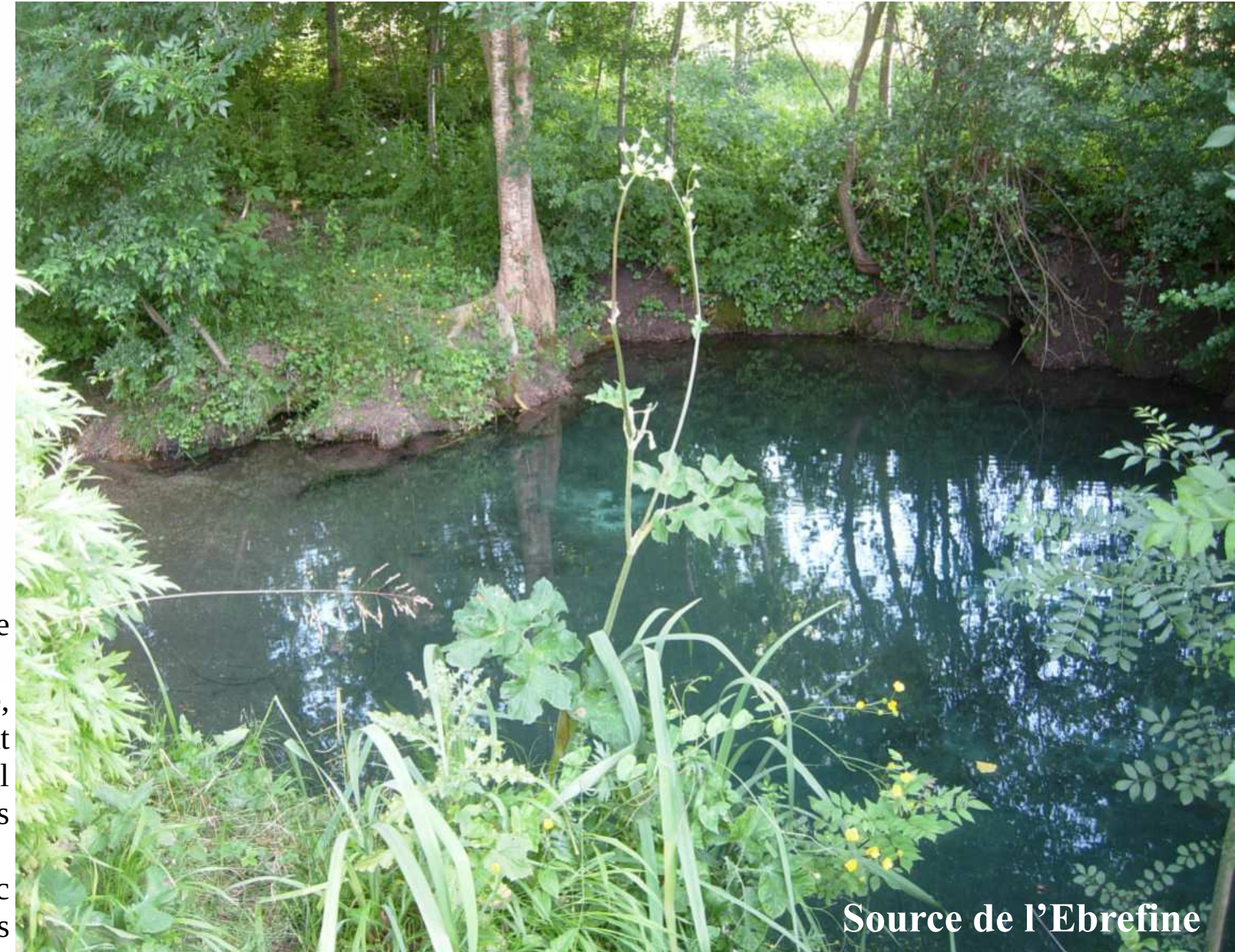
Source de l'Ebrefine

Distance 4,2 km - Durée 1h - Balisage vert