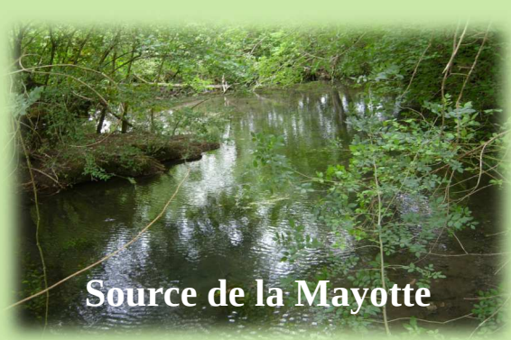
Source de la Mayotte