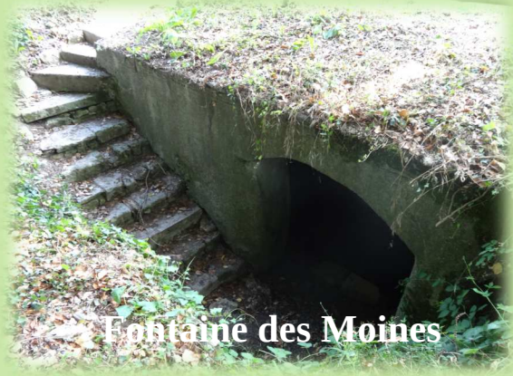
Fontaine des Moines